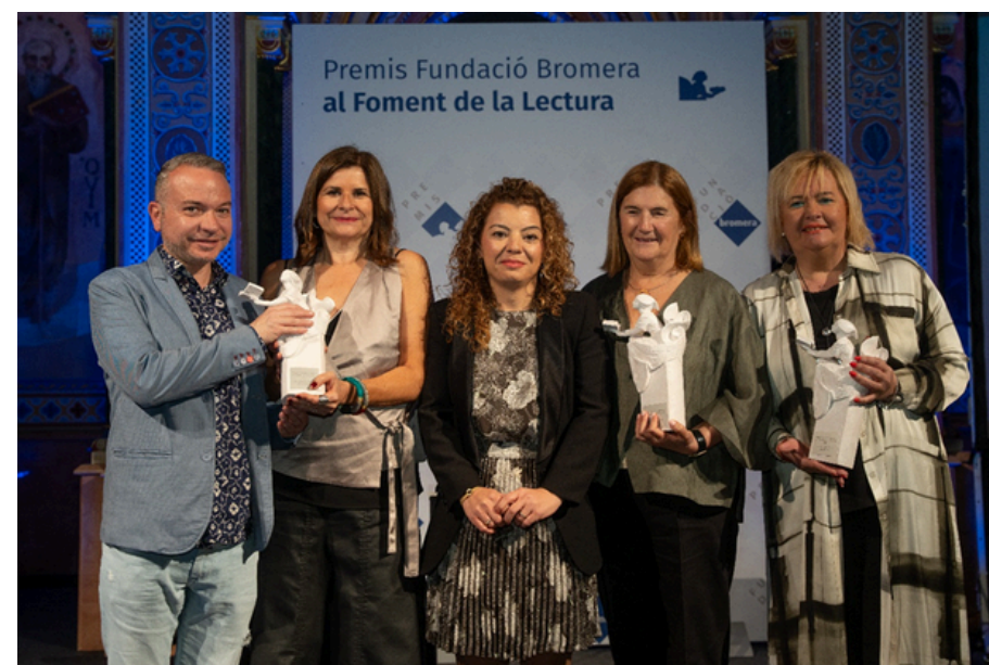
Guanyadors dels Premis Fundació Bromera al Foment de la Lectura 2024 amb la directora de la fundació.