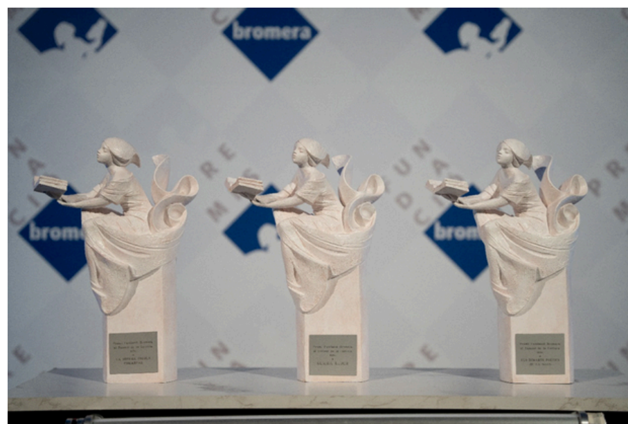
Escultura dels Premis Fundació Bromera.

Els objectius del guardó honorífic, que no té dotació econòmica, són distingir cada any a aquelles persones i entitats que han destacat pel seu treball a favor de la lectura en la nostra societat , tant com creadores d'una literatura de qualitat com pel seu compromís com activistes culturals. Una altra de les seues finalitats és la necessària creació de referents valencians procedents del món de la cultura i la literatura .