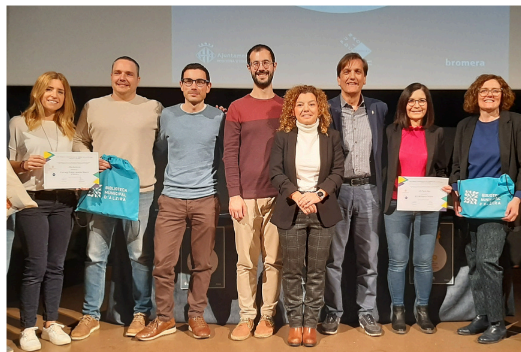
Lliurament del diploma del premi